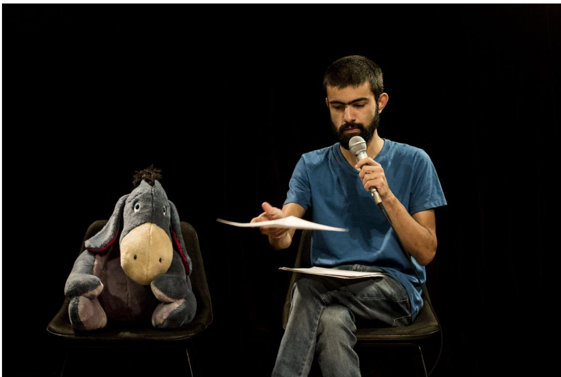
A performance O Narrador retorna ao CCJF após ser indicada aos prêmios Shell e Cesgranrio