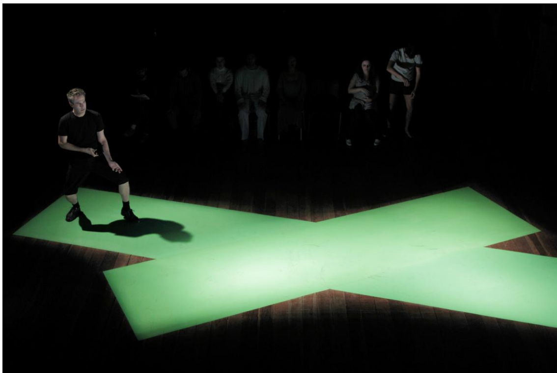
A tragédia Sinfonia Sonho ocupa o CCJF durante 4 semanas